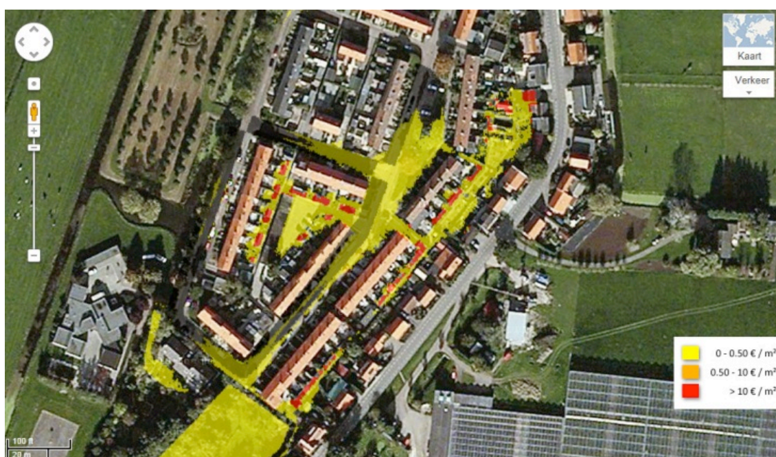
Afbeelding 3. Voorbeeld van een schadekaart. In deze wijk treedt vooral schade op aan de schuurtjes tussen de huizenblokken.

De uitgebreide berekeningen zijn vooral bedoeld voor de gevorderde gebruiker, die geïnteresseerd is in de baten van maatregelen. Met de schade van een enkele gebeurtenis kunnen namelijk geen baten bepaald worden. Voor het bepalen van de baten moet namelijk naast de schade ook de kans op deze wateroverlast worden meegenomen. In de WaterSchadeCalculator kunnen hiervoor met meerdere schadekaarten risico- en batenberekeningen worden uitgevoerd.