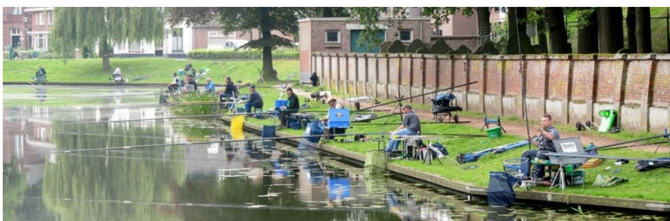
Figuur 8. Vissen in de Groenlose gracht

In de toekomst zal gevestigd blijven worden, vooral recreatief. Van beroepsvisserij in het stedelijk gebied is doorgaans geen sprake. In stilstaand water zijn veelal soorten aanwezig die houden van helder water met waterplanten (plantminnende soorten zoals snoek, baars en blankvoorn). Als er geen waterplanten aanwezig zijn is het water is veelal troebeler dan zijn dit soorten die van een slibbige bodem houden (karper en brasem). Deze laatste groep is over het algemeen beter bestand tegen een slechtere waterkwaliteit (o.a. hogere watertemperaturen, blauwalgen en lagere zuurstofconcentraties).