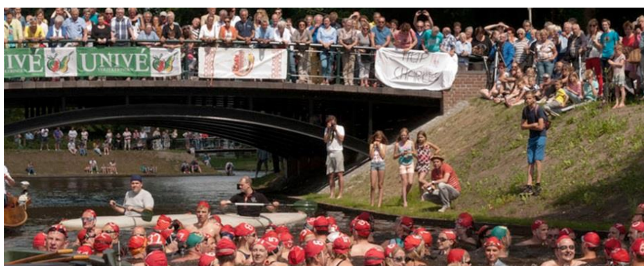
Figuur 7. Zwemmen in de Groenlose gracht

Zwemmen stelt van de hierboven genoemde recreatievormen de hoogste eisen aan waterkwaliteit. Zwemmen vindt niet alleen plaats in formeel zwemwater maar ook op allerlei andere plekken zoals grachten en kanalen. Onder andere als gevolg van hogere temperaturen wordt er meer gezwommen (54). Toename van waterrecreatie, inclusief zwemmen binnen en buiten daarvoor aangewezen locaties, wordt bevestigd door de geïnterviewden. Er zijn gemeenten die de ambitie hebben dat de waterkwaliteit buiten officiële zwemlocaties voldoet aan de eisen voor zwemwater.