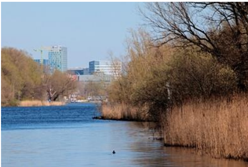
Figuur 6. Koud water uit de Nieuwe Meer in Amsterdam wordt gebruikt om gebouwen te koelen.