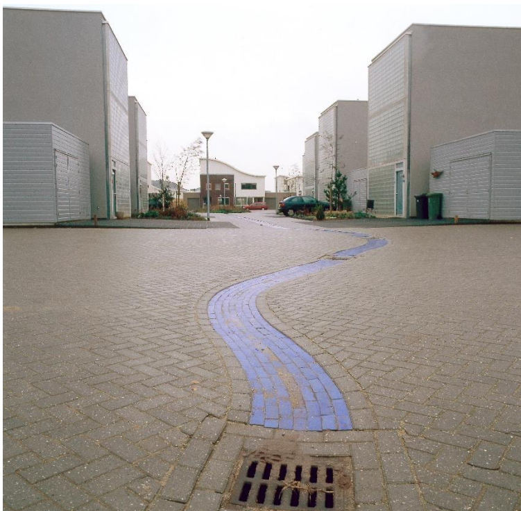
Figuur 12. Oppervlakkige verzameling en -afstroming van hemelwater middels molgoten.

wel beïnvloeden. Door het water langer op het wegdek af te laten stromen, te bergen en te verzamelen kunnen allerlei verontreinigen worden verzameld, zoals bijvoorbeeld (zware) metalen en oliën, maar ook nutriënten of strooizout. Deze verontreinigingen kunnen dan via infiltratie, hemelwaterafvoer, of overstorten van gemengde riolering in het (oppervlakte)watersysteem komen. Alternatieve maatregelen, zoals bijvoorbeeld het vergroten van het rioolstelsel, kunnen echter ook negatieve gevolgen hebben voor de waterkwaliteit. In grotere riolen zijn de stroomsnelheden gemiddeld lager waardoor vuil zich gemakkelijker ophoopt. In het geval van overstorten zal de vervuilingdruk dan groter zijn in vergelijking met een situatie met kleinere riolen waarin aanvullend waterberging op straat plaats vindt.