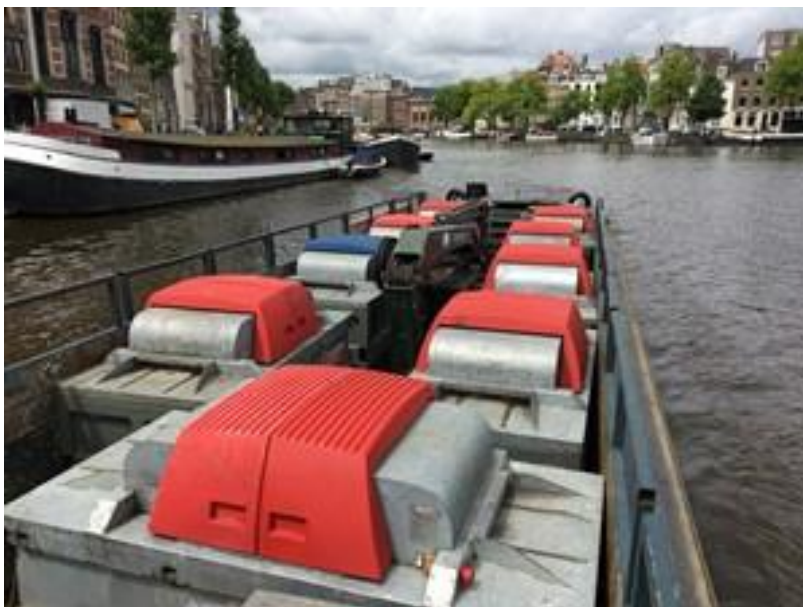
Figuur 9. Mokum Maritiem city supplier afvalboot op de Amstel in Amsterdam.

Stedelijk water is onderdeel van transportroutes voor lokaal, nationaal en internationaal transport van goederen en personen (e.g. Figuur 9). Dit betreft veelal transport door de stad of naar de stad. Transport binnen steden, zowel van goederen als bijvoorbeeld openbaar vervoer, is op dit moment beperkt. De vraag hiernaar zal, vooral voor goederentransport, waarschijnlijk toenemen omdat de beschikbare capaciteit van wegverkeer opraakt en gemeentes met vervoer over water invulling willen geven aan hun duurzaamheidsambities (44, 61-63).