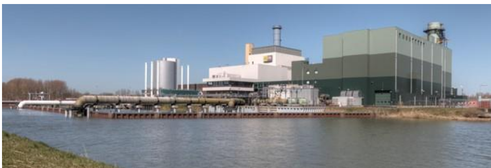
Figuur 5. Inlaatpunt koelwater energiecentrale

Naast lozingsbeperkingen kan klimaatverandering de koelwaterpotentie ook negatief beïnvloeden als gevolg van verzilting van het oppervlaktewater. Verzilting kan in zuidwest Nederland voor 6-14% (1-3 centrales) van de totale energieproductie leiden tot beperkingen. Andere centrales hebben niet te maken verzilting van het water dat zij gebruiken of zijn ingericht op het gebruik van verzilt water (41).