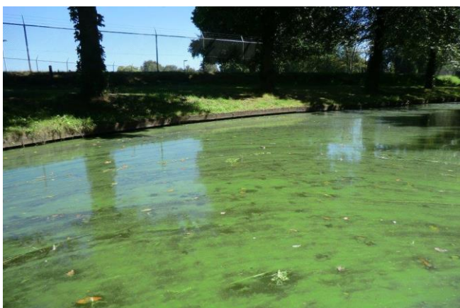
Figuur 3. Blauwalgenbloei

Klimaatverandering heeft wel een duidelijk effect op de fytoplanktonbiomassa via de toename van nutriëntenbelastingen zoals beschreven in Sectie 3.3.1, en via de invloed op de competitie tussen ondergedoken waterplanten en fytoplankton (Figuur 1). Over het algemeen resulteren hogere nutriëntenbelastingen in hogere fytoplanktonbiomassa's (23-26). Hogere watertemperaturen leiden vaak tot een andere fytoplankton soortensamenstelling. De fytoplanktongroep die het meest in verband wordt gebracht met klimaatverandering, is die van de cyanobacteriën (blauwalgen) (6, 21, 27-29). Hogere temperaturen zijn gunstig voor blauwalgen. Zo groeien sommige beter bij hogere temperaturen dan veel soorten groenalgen en/of kiezelwieren, waardoor ze een competitief voordeel hebben (30). Vooral bij een totaal-P belasting > 2,59 \text{ g P/m}^2/\text{jaar} , een zuurstofconcentratie van < 6 \text{ mg/L} en een watertemperatuur van > 25 \text{ }^\circ\text{C} zal de kans op een dominantie van cyanobacteriën toenemen (23, 29, 31). Kosten et al. (27) adviseert om ter compensatie van de effecten van een stijging van de watertemperatuur met 1 \text{ }^\circ\text{C} , de totale nutriënten concentratie te verlagen met maar liefst een derde.