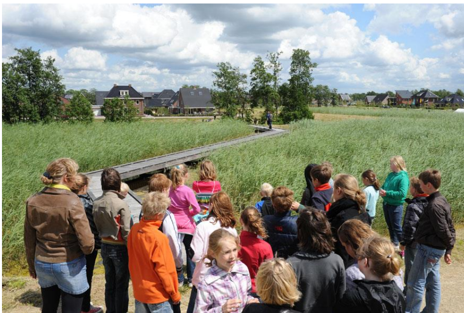
Figuur 13. Helofytenfilters in De Leemvallei, Leek.