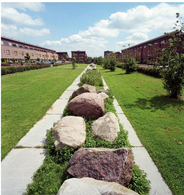
Figuur 11. Tijdelijke waterberging in het groen.

Bioretentie, het proces waarbij verontreinigingen en sediment worden verwijderd uit regenwaterafvoer, wordt toegepast als een instrument om de waterkwaliteitseffecten van klimaatverandering in stedelijke gebieden te helpen compenseren (37). Vegetatie kan een aanzienlijke invloed hebben op de stikstofverwijdering. Door gebruik te maken van wadi's, kan een grote hoeveelheid van de aanwezige stikstofvracht door de aanwezige planten worden weggevangen (37). Dit proces heet bioretentie. Fosforverwijdering lijkt minder te worden beïnvloed door de aanwezige planten dan stikstof. Het merendeel van de metaal- en koolwaterstofverwijdering in bioretentiecellen wordt toegeschreven aan niet-plantaardige mechanismen (37). Bioretentie-vegetatie heeft voordelen die verder gaan dan hydraulische processen en processen voor het verwijderen van verontreinigende stoffen. Planten leveren een belangrijke bijdrage aan de esthetiek van bioretentie, kunnen de behoefte aan irrigatie en bemesting verminderen, produceren voedsel en / of biomassa, zorgen voor thermische demping van regenwater, en zorgen voor een leefgebied voor dieren (37). Het laatste kan gezondheidsrisico's opleveren afhankelijk van de aanwezige soorten, en het gebruik (e.g. wordt er in de volgelopen wadi's gespeeld).