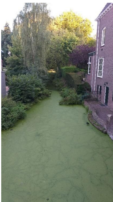
Figuur 4. Klein geïsoleerd stadswater in het centrum van Wageningen met een 100% bedekking van kroos.